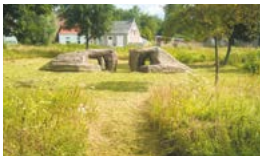
Espace vert de la ville

Vieux-Condé a à cœur d'associer ses habitants à l'embellissement de la ville et les incite chaque année à fleurir balcons, fenêtres et jardins. A la fin de l'été, la ville organise une cérémonie au cours de laquelle elle remet un bon d'achat de fleurissement aux participants.