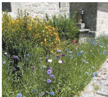
Jachère sauvage autour de l'église

Pour cela, la communication s'est faite naturellement. Le maire communique également à travers le Bulletin Municipal et se félicite des coups de projecteurs dont a bénéficié la commune via des articles de presse ou des reportages radio et TV. Un rayonnement qui motive les habitants de la commune à continuer sur cette voie.