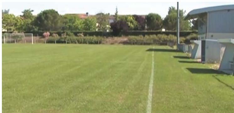
Terrain de sport de L'Isle d'Espagnac