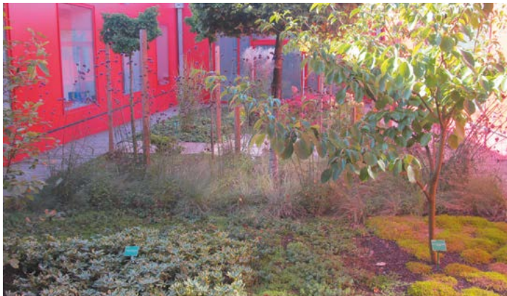
Patio végétalisé de l'école Solitude