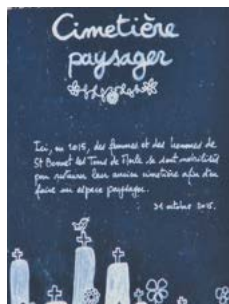
Cimetière de Saint-Bonnet-les-Tours-de-Merle

La transition vers le zéro pesticide n'est pas qu'une question de pure substitution technique, qui entraînerait une augmentation des coûts de gestion. Elle s'appuie sur le changement global de la gestion des espaces, tout en reposant sur une optimisation quotidienne pour atteindre des objectifs environnementaux et sociaux sous contraintes budgétaires.