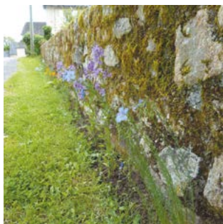
Bordures de routes enherbées